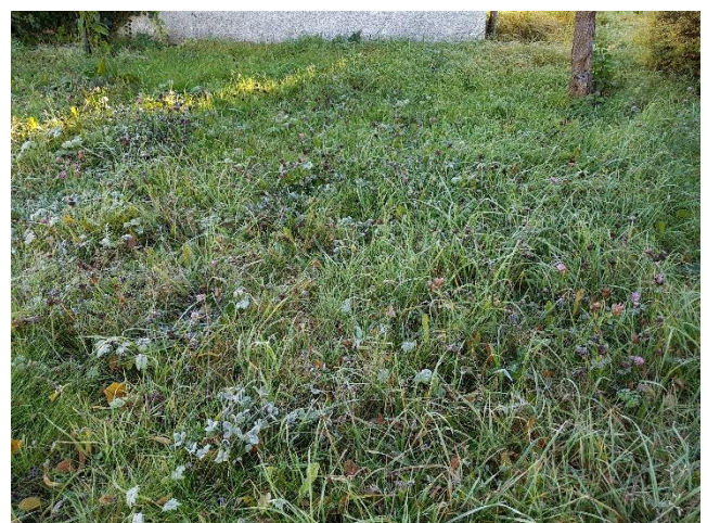
Foto 6: Ruderalisierter Zierrasen (14.10.2021)