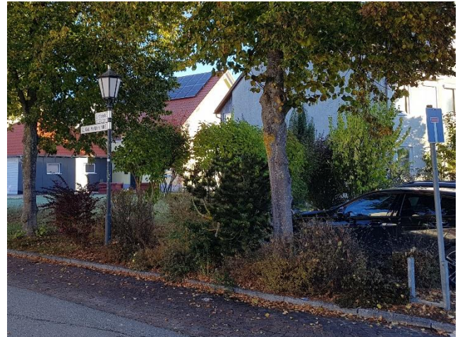
Foto 2: Zierstrauchanpflanzung als Einfriedung der Stellplätze (14.10.2021)