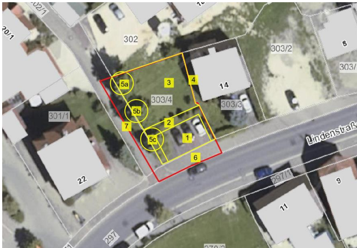
Legende: Rote Linie = Bebauungsplangebiet, gelbe Linie = Abgrenzung Biotope/Strukturen, Nr. 1 – 7 = siehe Tabelle 1