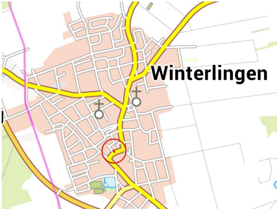
Abbildung 1: Übersichtslageplan (ohne Maßstab)