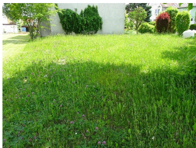
Foto 5: Ruderalisierter Zierrasen (11.06.2021)