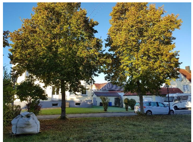
Foto 10: Baumreihe (14.10.2021)