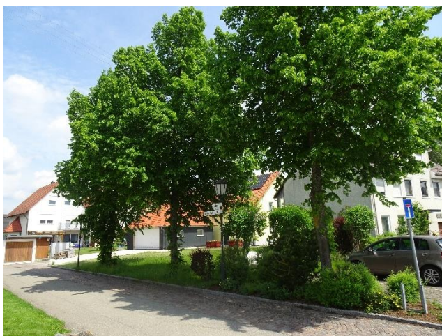
Foto 9: Baumreihe aus 3 Linden (11.06.2021)