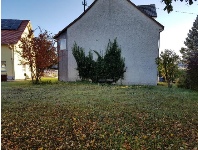
Foto 7, 8: (ehemaliger) Sitzplatz auf den Nachbarflurstück 303/3 (14.10.2021)