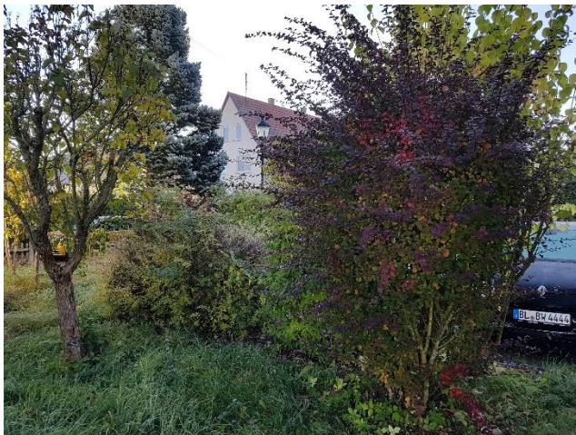
Foto 3, 4: Zierstrauchanpflanzung als Einfriedung der Stellplätze (14.10.2021)