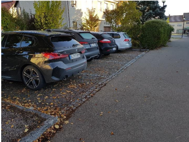
Foto 1: 4 PKW-Stellplätze an der Lindenstraße (14.10.2021)