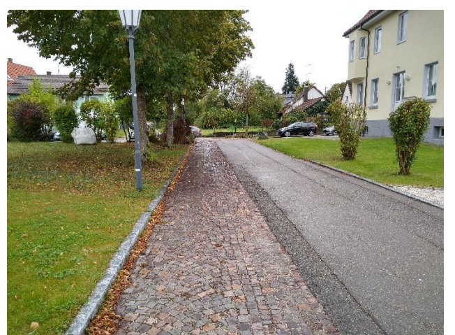
Foto 12: Seitenstraße der Lindenstraße mit gepflasterten Seitenstreifen (05.10.2021)